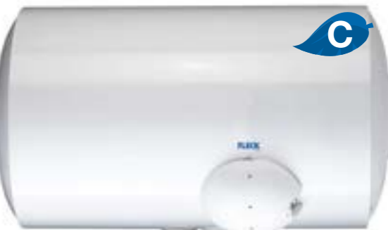
TH STE 150 - 200 LITROS