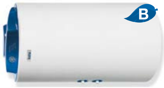
TH 80 - 100 LITROS