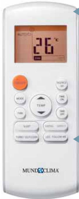
RG57A6/BGE (CL 94 588)